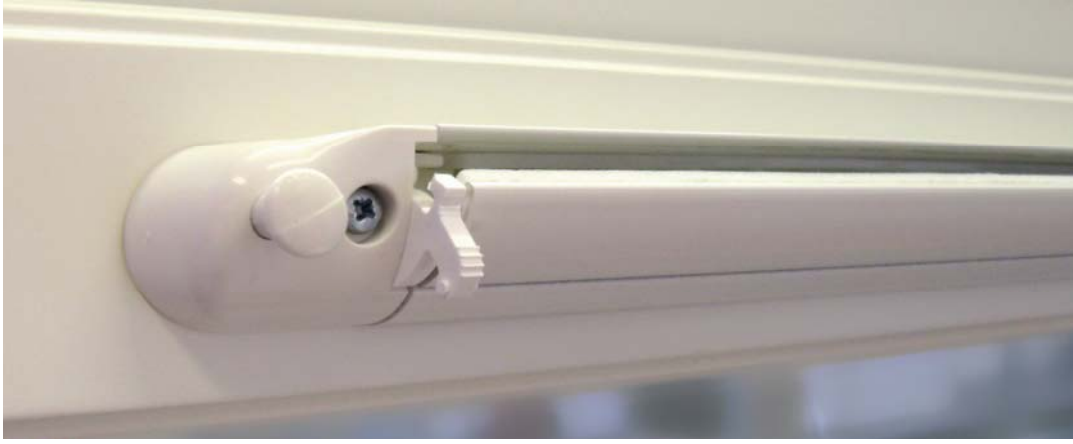
ThermoVent sulautuu kauniisti ikkunapuitteeseen. Sen mitat ovat 373 x 24 mm.