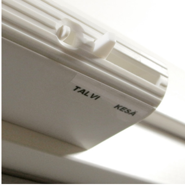
Sisäyksikön irrotusvipu ja manuaalinen kesä/talviasennon säädin sijaitsevat vierekkäin.