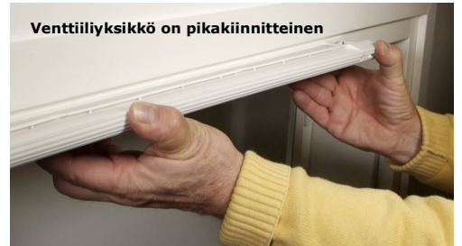
Ilmankierron ohjausyksikkö varustettuna automaattitermostaatilla